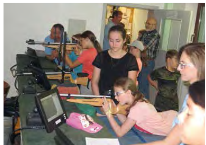
2018 – Schnupperschießen