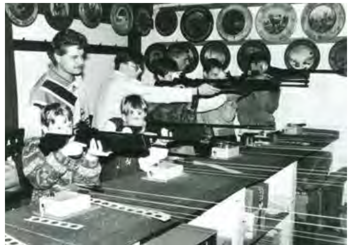
1995 – Jugendtraining