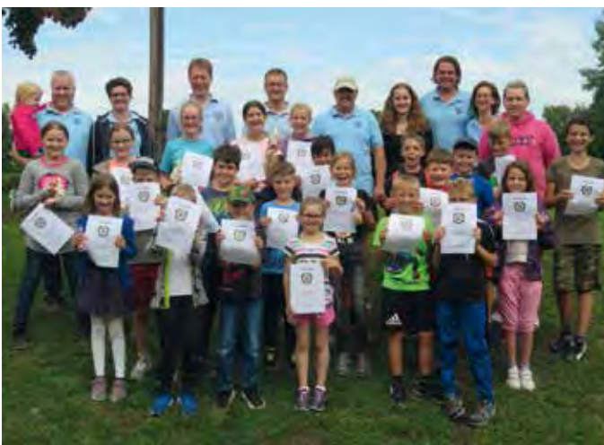
2019 – Spaßbiathlon der Schützen beim Ferienprogramm

36 Jahre hat der SV „Adler“ Bürglein (Gau Ansbach) das Raiffeisen-Wanderpokalschießen organisiert. Künftig soll es jedes Jahr bei einem anderen Verein stattfinden. Die SSG Rohr übernimmt zuerst diese Verantwortung. Erfolgreicher Neustart mit 78 Teilnehmern aus elf Schützenvereinen und drei Schützengauen (AN, FÜ und SC-RH-HIP).