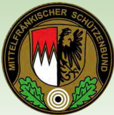
96. Mittelfränkisches Bundesschießen