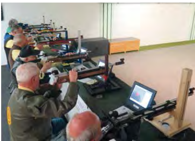
2016 – Gauschießen