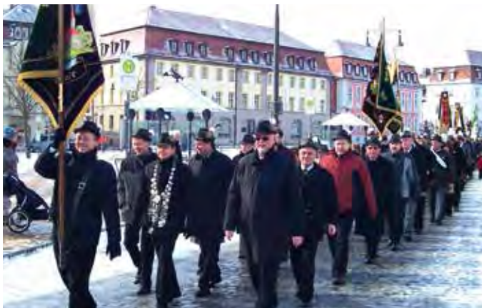
1996 – Festzug in Ansbach

Erste LG-Mannschaft wird wieder souverän Meister der Gauoberliga. Beim Ausscheidungsschießen zum Aufstieg in die Bezirksliga ist die SSG Rohr dieses Mal erfolgreich. Erstmals schießen wir in der Bezirksliga!