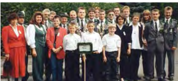
1996 – Festzug Gauschützenfest Worzeldorf