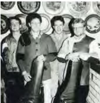
1995 – Die erste Mannschaft steigt in die Gauliga auf