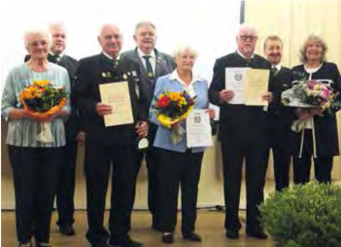
2022– SSG Rohr, 50 Jahre, Ehrungen

kulturelle Beiträge aufgelockert. Die drei noch lebenden Gründungsmitglieder und zahlreiche langjährig ehrenamtlich Aktive werden vom BSSB, MSB, Schützengau und Verein geehrt.