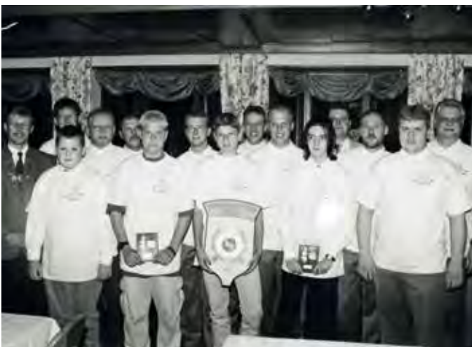
1999 – Meisterschützenempfang

Seit 1998 lädt die SSG Rohr zum Osterschießen und zum Pelzmärtelschießen ein.