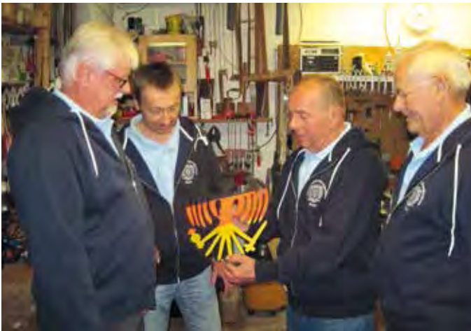
2012 – 40 Jahre SSG Rohr – Holzadlerscheibe

Im Oktober beteiligt sich der Verein am bundesweiten „Tag der Schützenvereine“ mit einem bunten Programm.