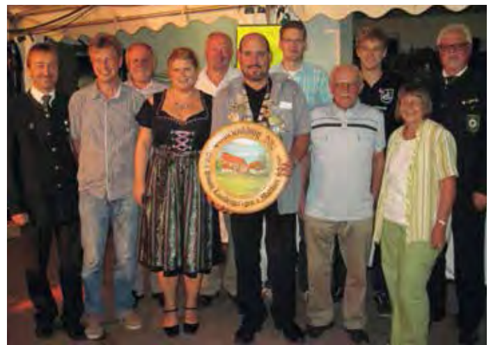
2012 – Bürgerschützenkönigsproklamation mit Landrat Herbert Eckstein und Bürgermeister Herbert Bär