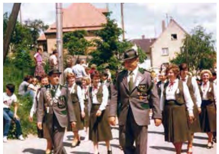
1981 – Festzug in Eckersmühlen