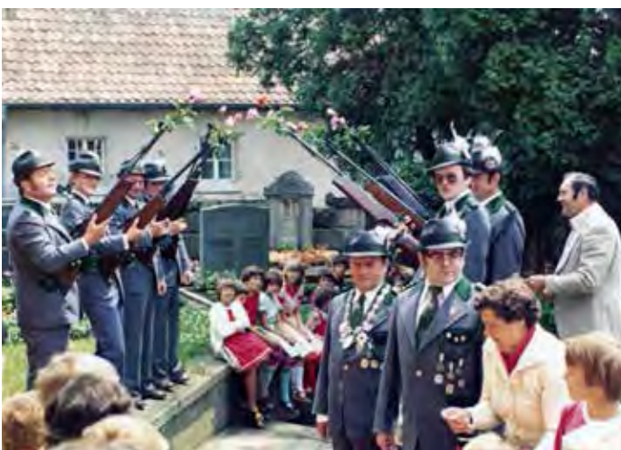
1978 – Spalierstehen bei einer Hochzeit